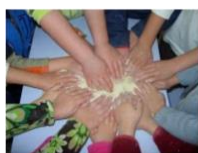
Asociació Cultural Escuela Polaca

Wizyta na Islandii dostarczyła nam wielu refleksji i przeżyć związanych z kwestiami natury, jej potęgi i piękna. Dziękujemy wszystkim zaangażowanym w